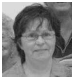
Mot de la présidente

De plus, cinq membres de la SHQ se sont impliqués dans le projet «Balcon fleuri» au Manoir Stadacona lors de l'atelier de montage de boîte à fleurs, en mai dernier, et lors du jugement des boîtes à fleurs et