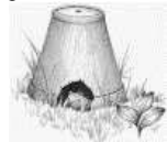
Ici avec un port d'argile

En une seule saison, un crapaud actif peut manger plus de 10 000 insectes. Les crapauds aiment se cacher durant le jour dans des endroits frais et sombres, et sortent la nuit pour chasser. Il n'est pas étonnant qu'ils évitent les pelouses impeccables entretenues aux pesticides. Pour attirer les crapauds dans votre jardin, procurez-leur un abri :