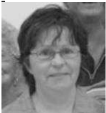
Mot de la présidente